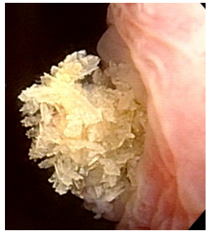
膀胱に落ちる寸前の尿管結石

写真の記録は電子カルテに保存、必要であれば動画も記録できます。一番新しい膀胱鏡はハイビジョン・システムで、3月より当院でも導入し、鮮明な画像で検査を行っています。